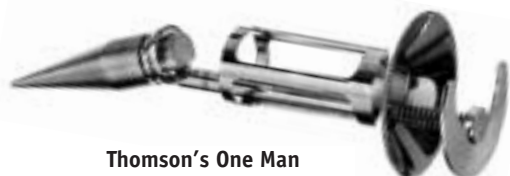
Thomson's One Man